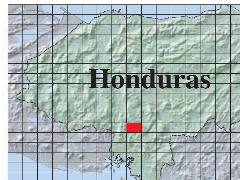
Ubicación de Cuadrángulo Location of Quadrangle 2757 IV

Los números indicatos arriba son números de referencia de los cuadrángulos. Numbers in above index are National Imagery and Mapping Agency numbers.