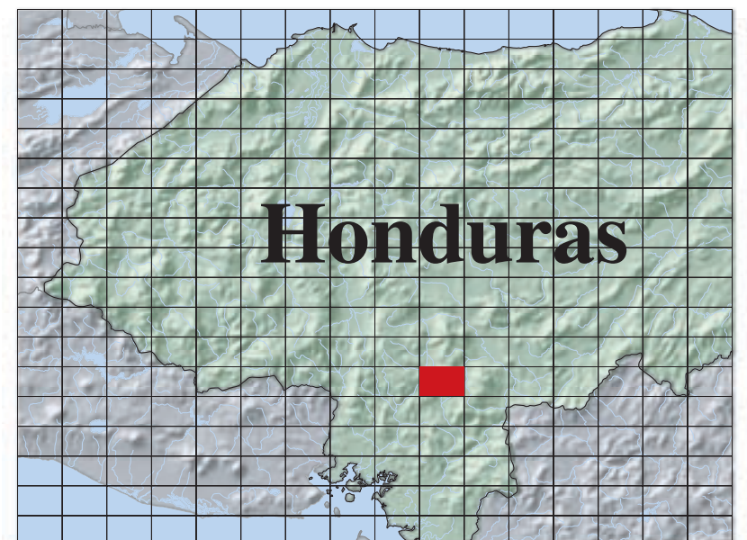
Ubicación de Cuadrángulo Location of Quadrangle 2757 I

Índice de hojas adyacentes. Index of adjoining quadrangles. Los números indicatos arriba son números de referencia de los cuadrángulos. Numbers in above index are National Imagery and Mapping Agency numbers.